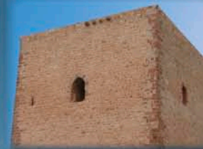
Castillo de Terrinches