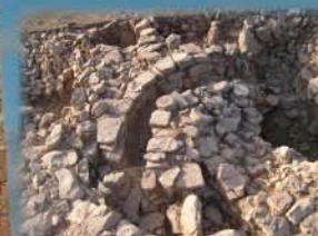
Castillejo de Bonete