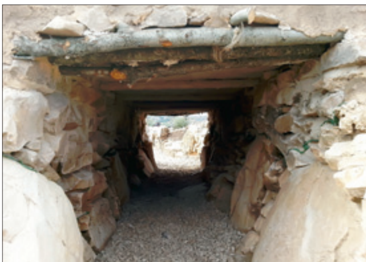
Reconstrucción de uno de los pasillos megalíticos que se dirigen al túmulo ritual