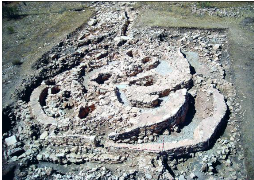
Vista aérea del Castillejo del Bonete.

A partir de la finalización de este proyecto, se ofrecerá un paquete con visitas guiadas sistemáticas y gratuitas para que todos los turistas y aficionados a la Historia puedan conocer a fondo el trabajo que se ha realizado en ambos lugares. Según Peláez, «están muy avanzados y sólo queda puntualizar algunas cosas relacionadas con la señalética y la interpretación», un trabajo que ha corrido a cargo