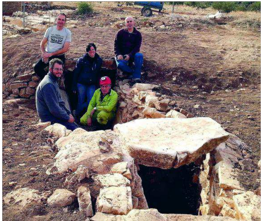
Visita de expertos de la Universidad de Granada al túmulo del Castillejo del Bonete.

PUBLICACIONES. Los más de diez años de trabajo en los yacimientos de Terrinches tienen su reflejo en las revistas especializadas. El próximo mes de junio verán la luz dos artículos diferentes en las «revistas científicas específicas de Prehistoria con repercu-