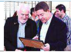
García-Page participó ayer en un acto en Moral de Calatrava.